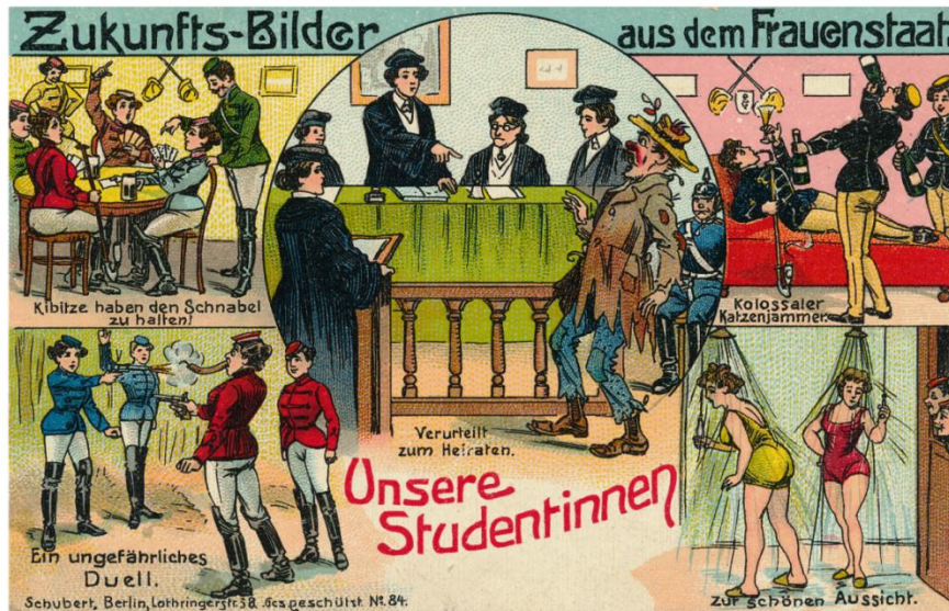
Abb. 4: „Zur Frauenbewegung“