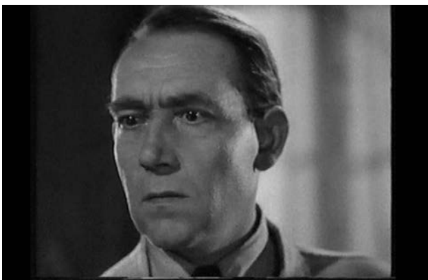
Szene 4: Hannas Blick in den Spiegel