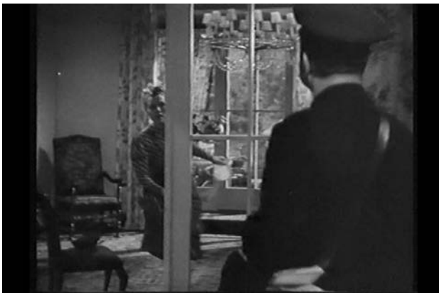
Szene 6: Hausmusik auf der Berufungsfeier